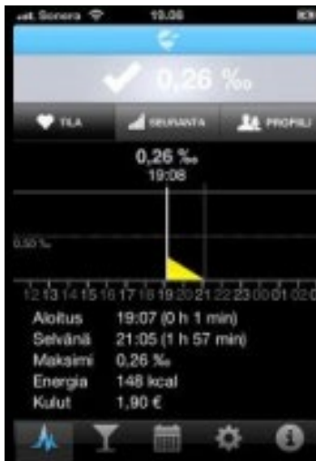
Mobiiliapu on kasvanut vuoden alussa uudella jäsenellä: OttoMitta.

Mobiiliapu OttoMittasta on sanottu muun muassa näin: ”Rohkaisu ja kannustus ovat onnistumisen parhaat apuvälineet”. ■